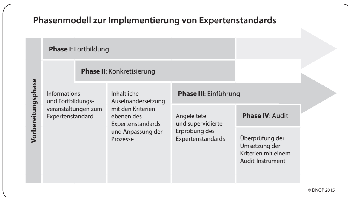
Abbildung 2: Phasenmodell zur Implementierung von Expertenstandards

raums für alle Beteiligten hohe Anforderungen stellt. Es zeigt sich jedoch, dass dieser begrenzte Zeitraum maßgeblich zu einer Motivationsförderung beiträgt. So ist es möglich, eine Balance zwischen hoher Beanspruchung aller Beteiligten und sichtbaren Ergebnissen zu halten (Moers et al. 2014).